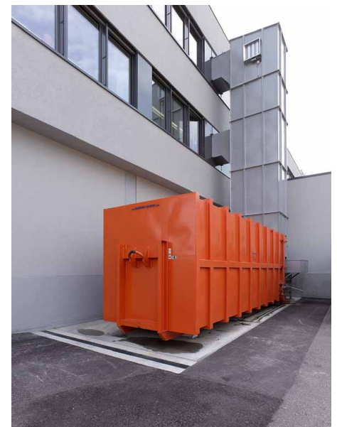
Presscontainer mit Abwurfschacht

IE durchleuchtet zu Beginn alle Prozesse im Betrieb, um den Bau so zu gestalten, dass im Rahmen des Umbaus auch kleine Effizienzfallen ausgemerzt werden. Bei Otto Fischer fiel den Experten von IE auf, dass die grossen Mengen an Verpackungsmaterial auf verschiedenen Stockwerken gesammelt und auf langen Wegen von Mitarbeitern mehrmals täglich in den Aussenbereich transportiert wurden. Ein Abwurfschacht, der von jedem Stockwerk aus zugänglich ist, sorgt jetzt für die sekundenschnelle Entsorgung des Verpackungsmaterials. Einfache Massnahmen, grosse Zeitersparnis.