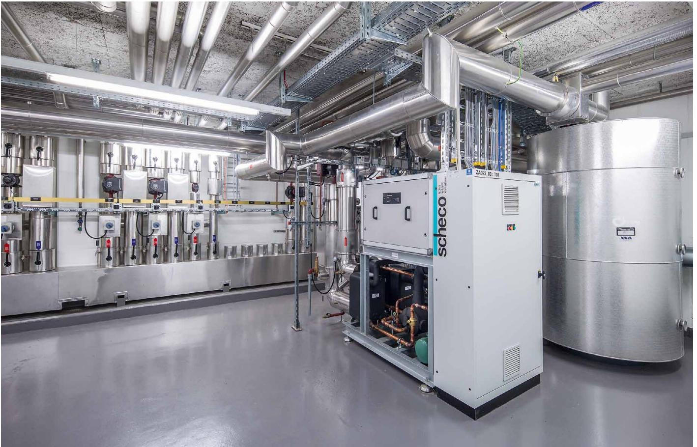
Heizzentrale mit Wärmepumpe